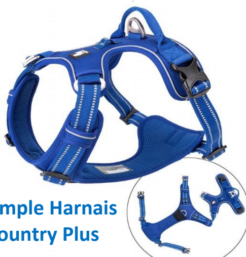
Exemple Harnais Country Plus